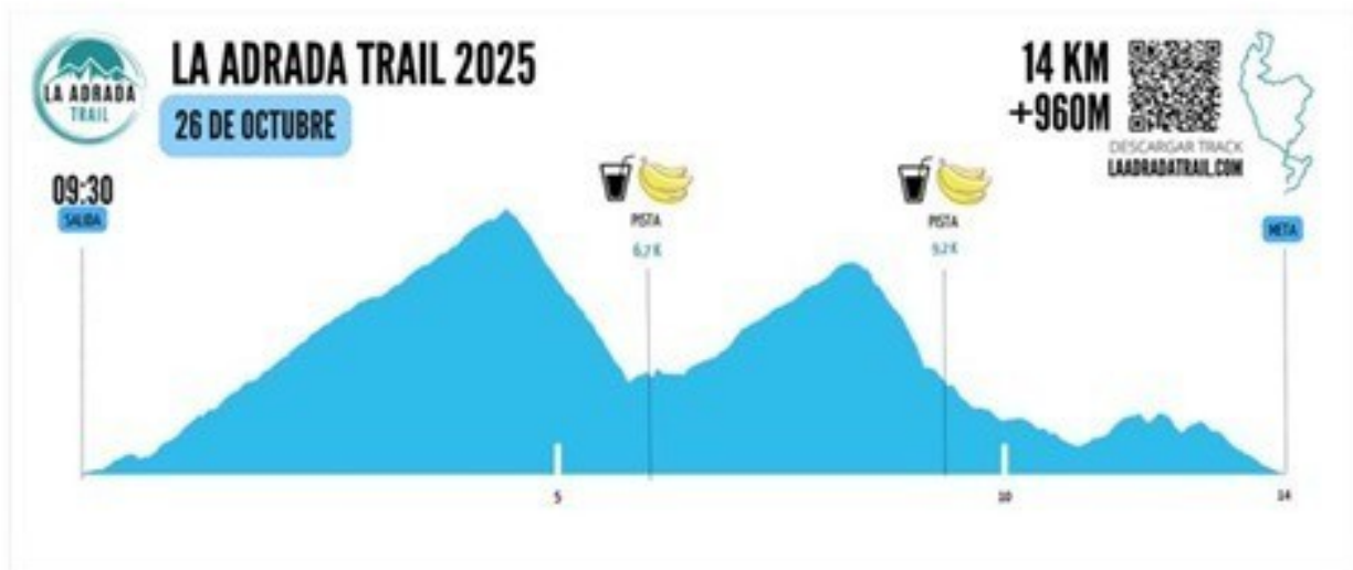
Perfil carrera 14 km La Adrada Trail 2025

En todos los avituallamientos hay acceso vehículos para la evacuación de personas.