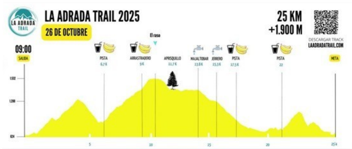
Perfil carrera 25 km La Adrada Trail 2025

En todos los avituallamientos hay acceso vehiculos para la evacuación de personas.