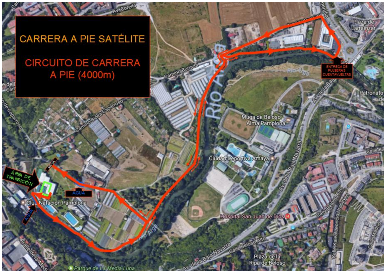
IMAGEN DEL CIRCUITO DE LA CARRERA A PIE.

- Serrería – Casa de Goñi (1200m): Desde la serrería se seguirá el mismo trayecto que en la ida hasta llegar a la altura del “ punte verde ”. Una vez allí, en vez de seguir recto como lo se hizo a la ida, se dará un giro de 90° a la derecha (en ligera bajada) para poner rumbo a la Casa de Goñi . En este punto, frente al aparcamiento, estará situado el avituallamiento y 100m más adelante estará situada la meta.