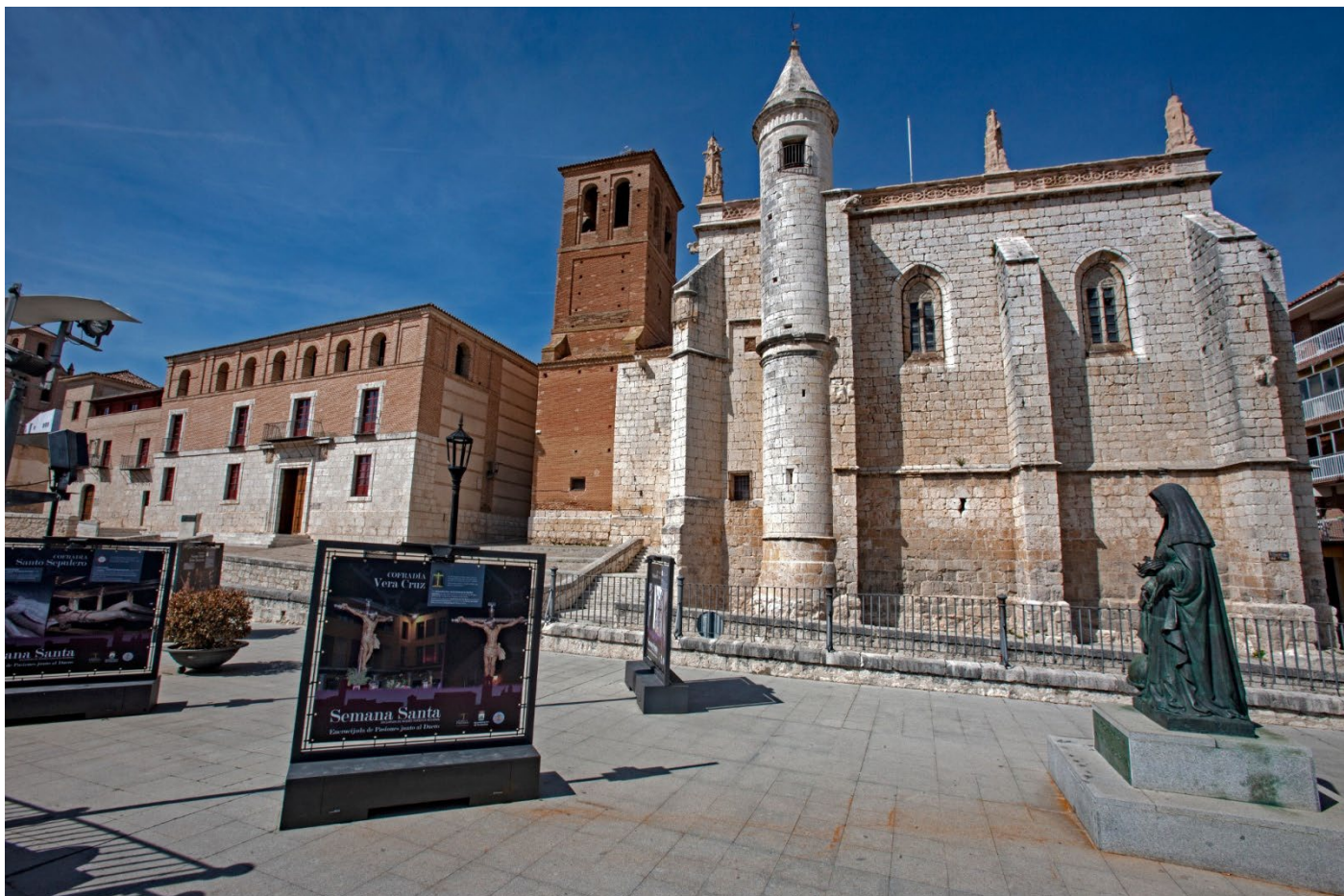
CASAS DEL TRATADO