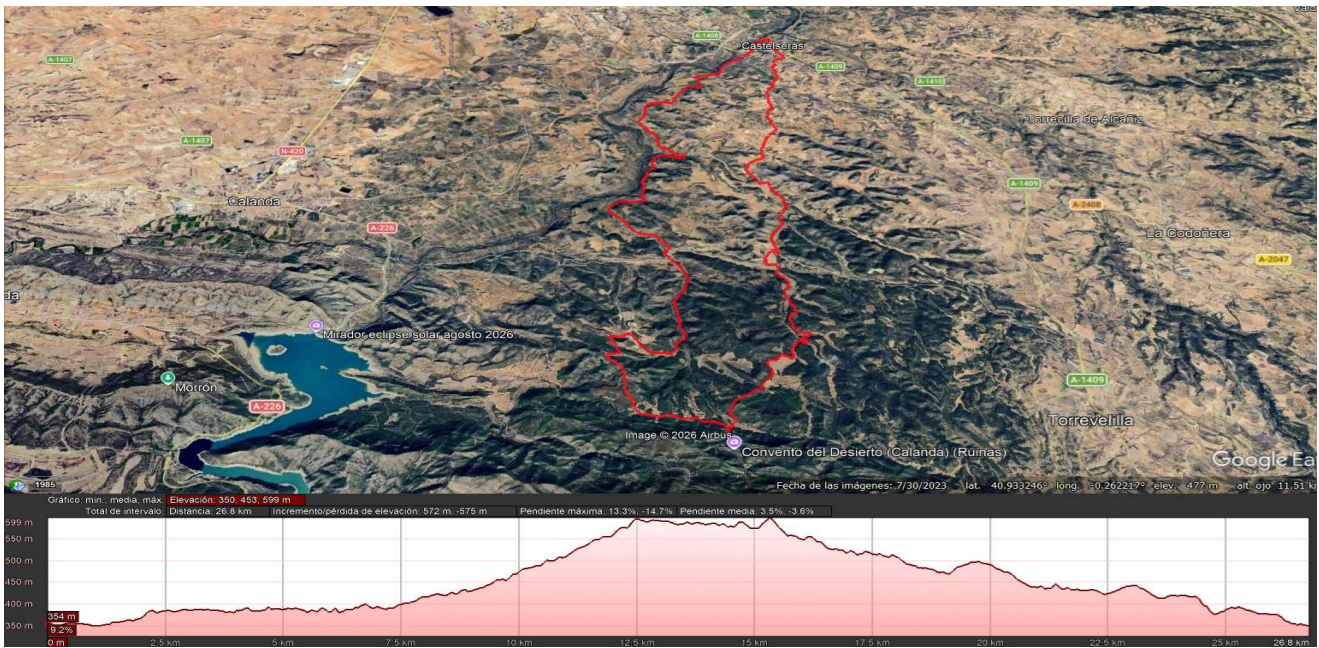
(Croquis y perfil del recorrido corto)

- Recorrido corto: 27 km y desnivel positivo +347, de dificultad técnica media/alta