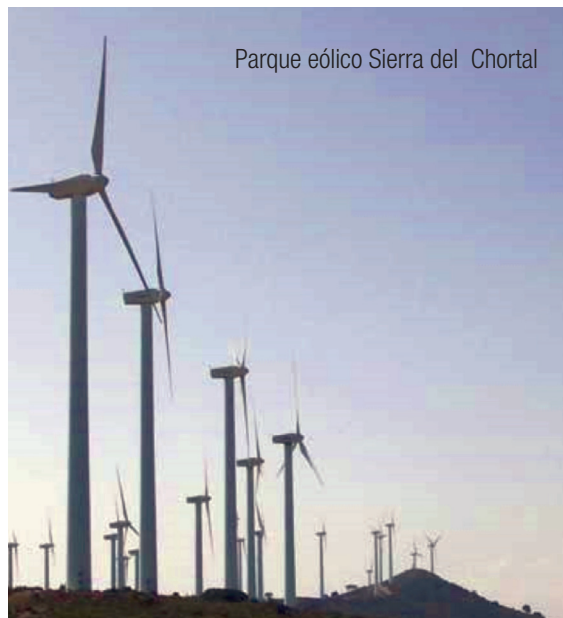
Parque eólico Sierra del Chortal