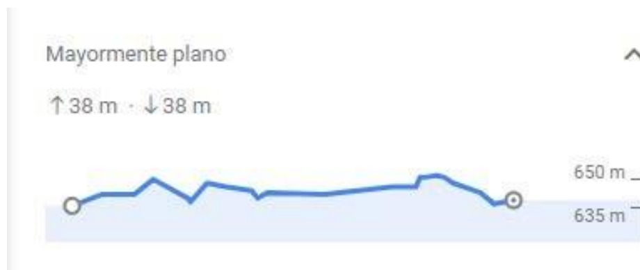
Ilustración 2 - Desnivel trazado de circuito