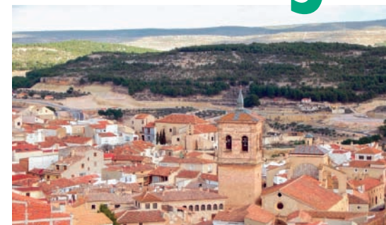
Vista panorámica de Chinchilla desde el castillo