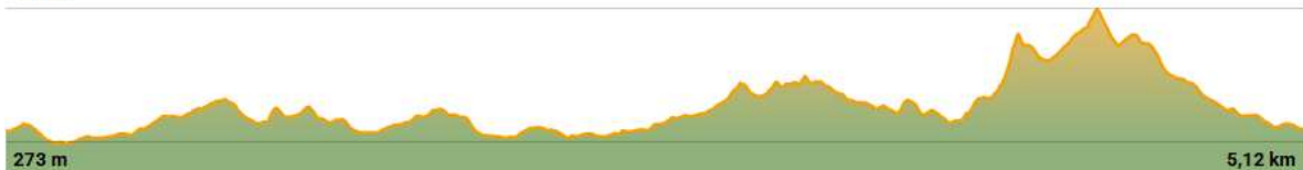
TABLA TÉCNICA LOBERAS TRAIL MONZÓN